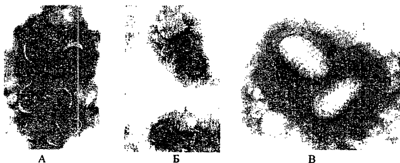
Рис. 2. Вирионы вируса ветряной оспы (А и Б) и вирионы паравоксвируса (В) А — вирус ветряной оспы с наружной оболочкой-конвертом при увеличении 100 000; Б — тот же вирус без наружной оболочки при увеличении 168 000; В — вирионы паравоксвирусов (паравакцины)

Заключение о результатах исследования основывается на данных просмотра не менее 2 сеток от большого. Обнаружение 3 и более вирионов с характерной для ортопоксвирусов морфологией считается достаточным для заключения о наличии в материале ортопоксвирусов. Для отрицательного заключения в каждой из двух сеток просматривают не менее \frac{3}{4} ячеек в течение 30 мин.