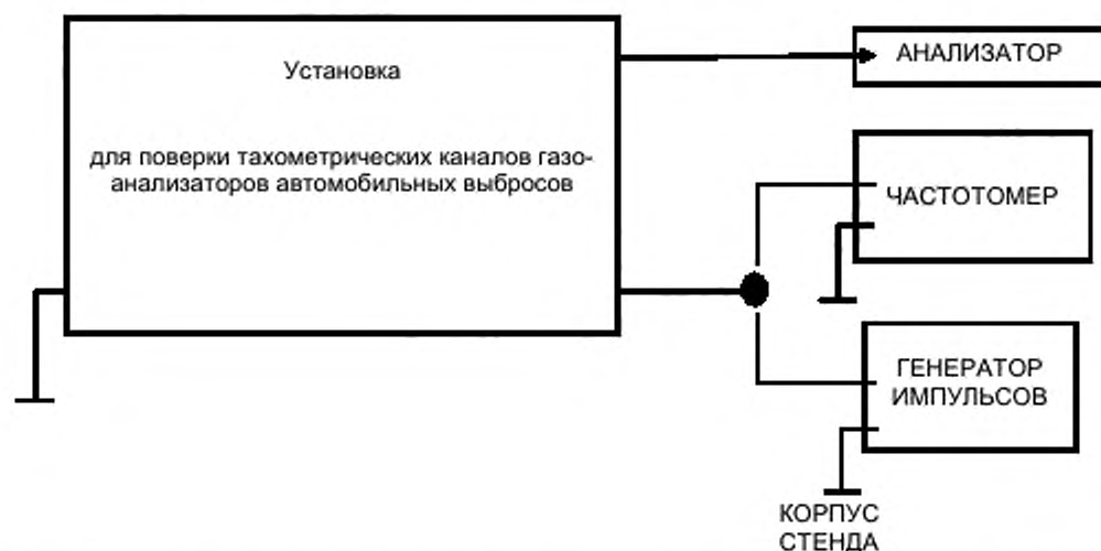
Рисунок В.2 – Схема для определения погрешности измерения частоты вращения коленчатого вала двигателя