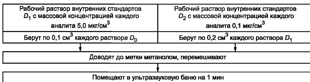
Рисунок 2 — Приготовление рабочих растворов внутренних стандартов D_1 , D_2

Рабочие растворы D_1 , D_2 готовят в мерных колбах вместимостью 10 см 3 согласно рисунку 2.