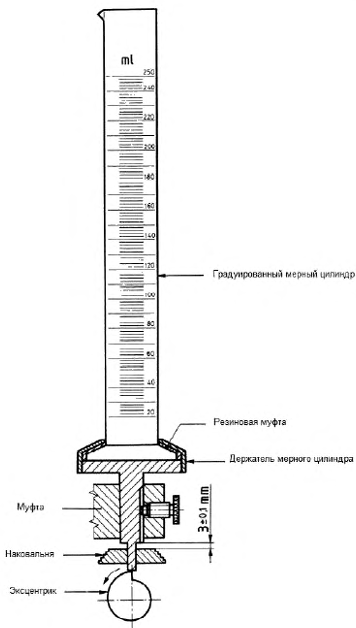
Рисунок 2 – Толчковый измеритель объема