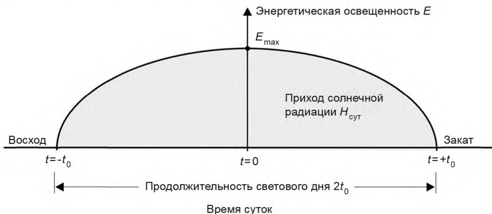
Рисунок 1 — Иллюстрация к обозначениям. Связь между параметрами, характеризующими условия места установки

Рисунок 1 поясняет приведенные обозначения.