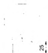
Рисунок 103 – Конфигурация шланга для его замораживания Промежуточное положение

Примечание – Любое обесцвечивание не допускается.