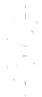
Положение шланга в начале и конце каждого изгиба Рисунок 104 – Положения изгиба для шланга после извлечения из морозильного шкафа