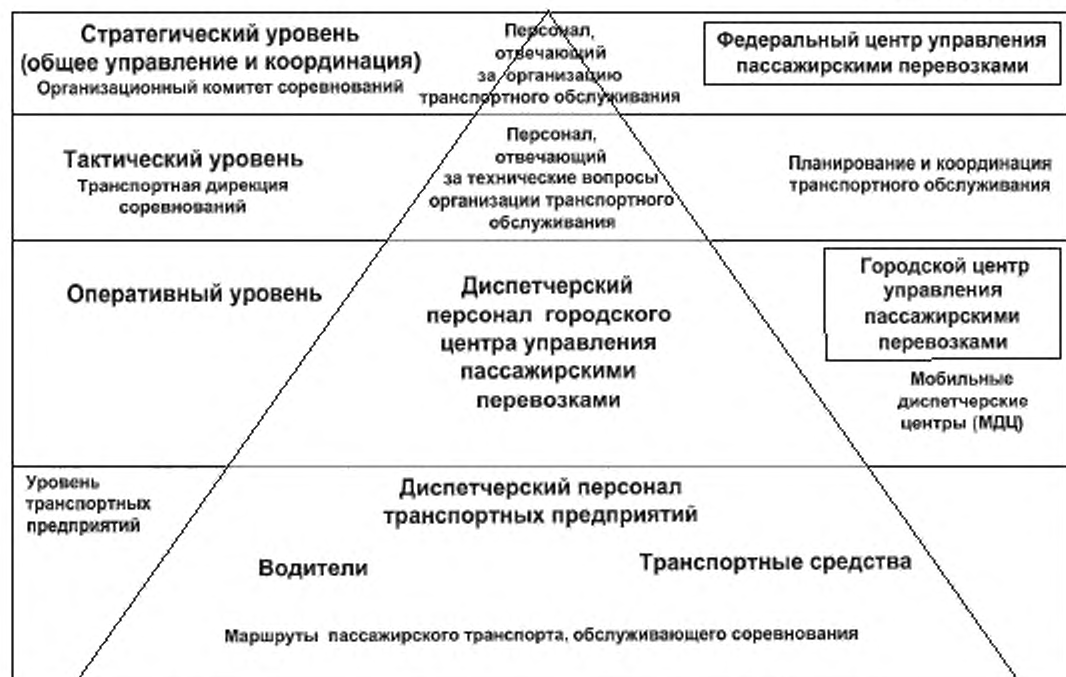
Рисунок 1 – Иерархические уровни ситуационного управления процессами транспортного обслуживания зрителей массовых спортивных мероприятий

4.3 Тактический уровень управления реализуется специально создаваемой организацией – транспортной дирекцией соревнований, на которую возлагаются технические вопросы планирования, организации и координации транспортного обслуживания, включая: