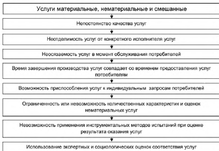
Рисунок 2 — Специфические особенности услуг

Поэтому при разработке и внедрении системы менеджмента качества в организациях, предоставляющих услуги населению, необходимо учитывать особенности сферы услуг.