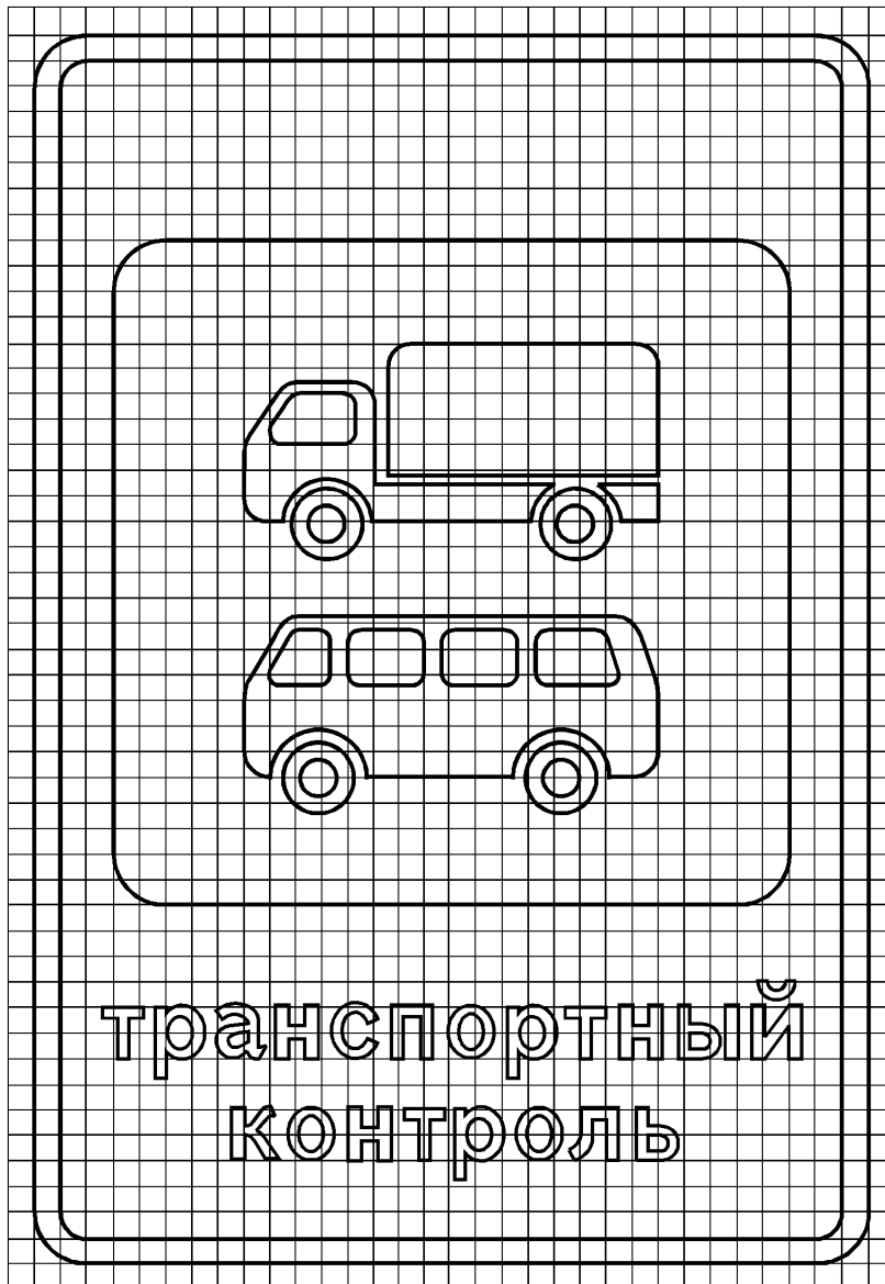
Рисунок Б.1 — Знак 6.13